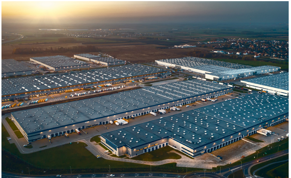
Planungsbild Logistikanlage Creedmoor Phase I und Phase II

Kumuliert haben mehr als 50.000 Privatanleger über die Vehikel der DEUTSCHE FINANCE-Gruppe ihr Kapital anvertraut. Das verwaltete Vermögen erreicht per 31.03.2024 ein Volumen von ca. EUR 12,2 Mrd. Die Vorgaben zur Diversifikation und Streuung der Investitionen in weltweit aufgestellte, institu-