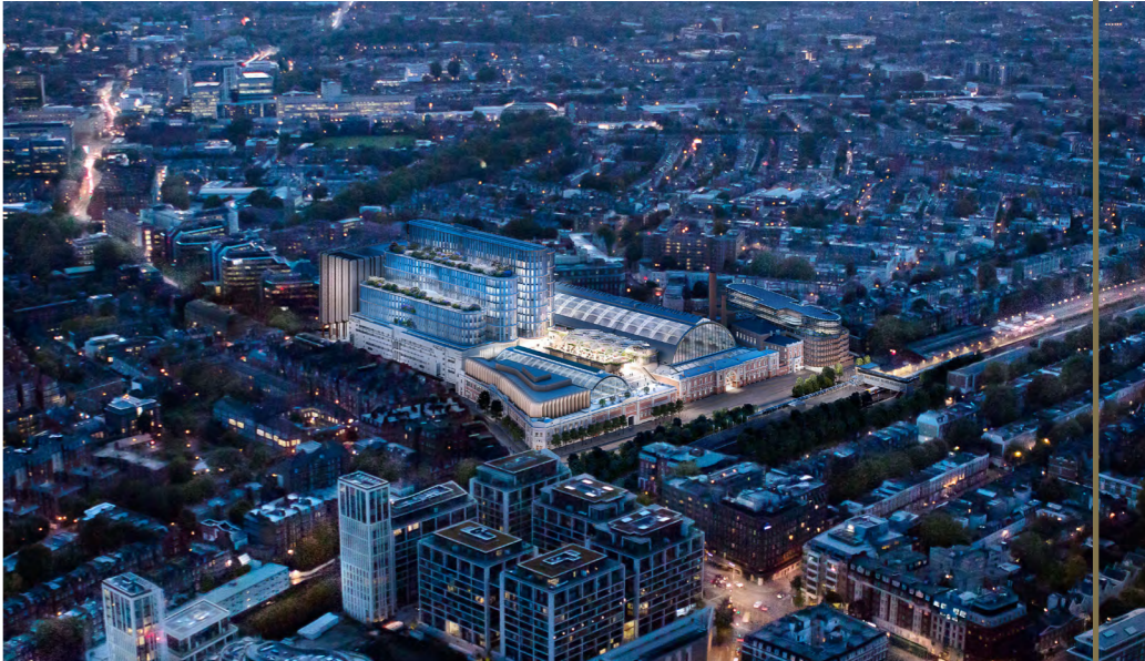
OLYMPIA EXHIBITION CENTRE – LONDON