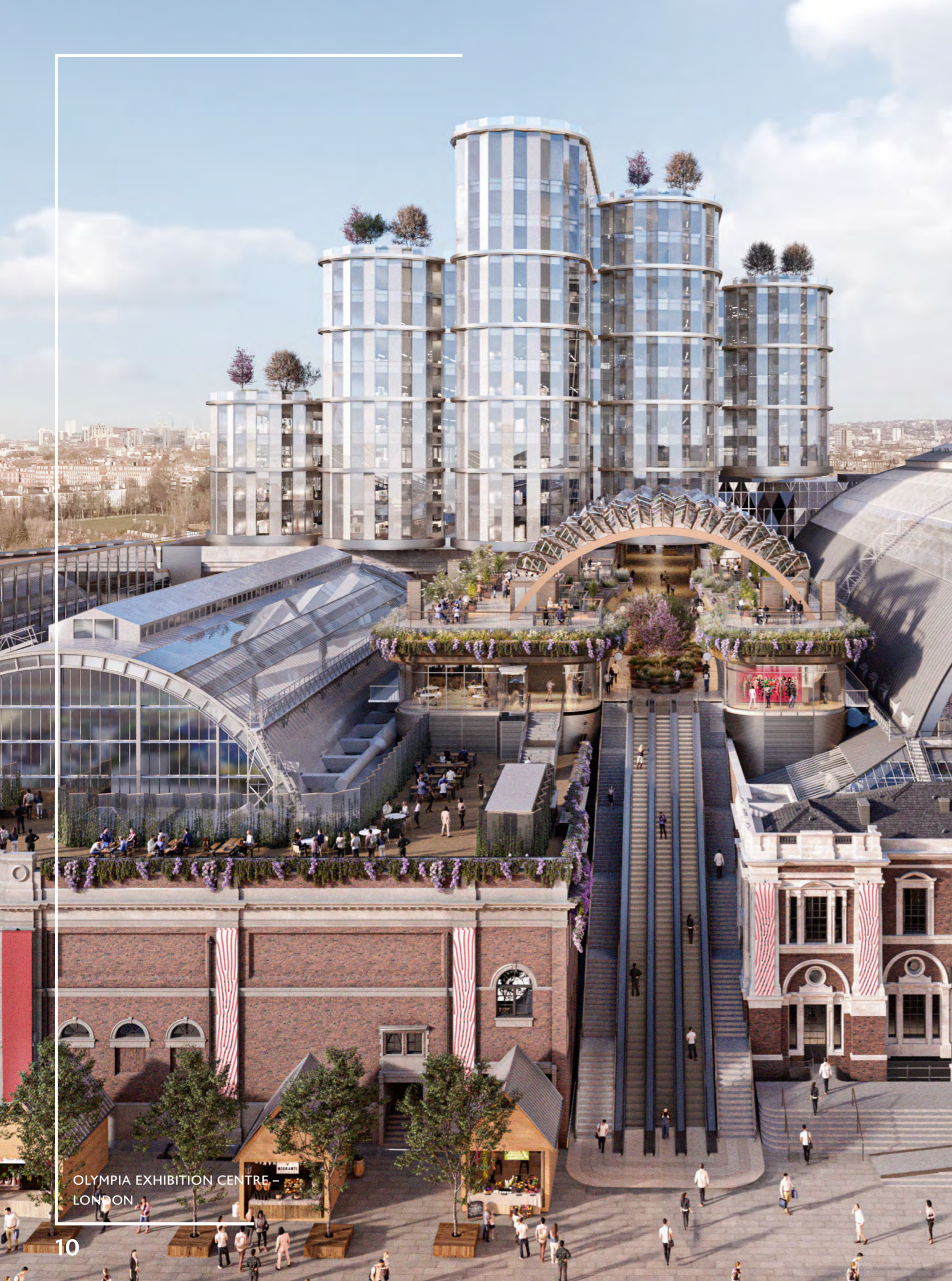
OLYMPIA EXHIBITION CENTRE – LONDON