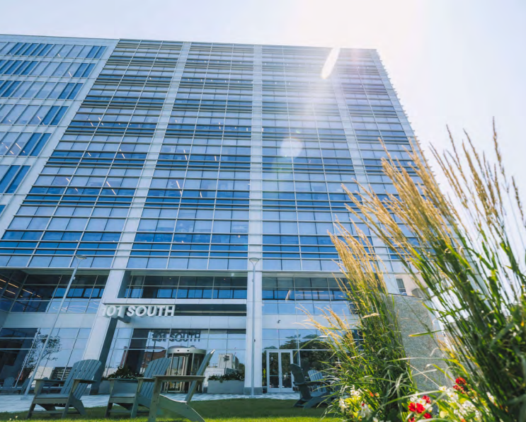
101 SOUTH STREET – LIFE SCIENCE – BOSTON

Die DEUTSCHE FINANCE GROUP integriert nachhaltige und innovative Investmentstrategien in die Phasen der Wertschöpfungskette.