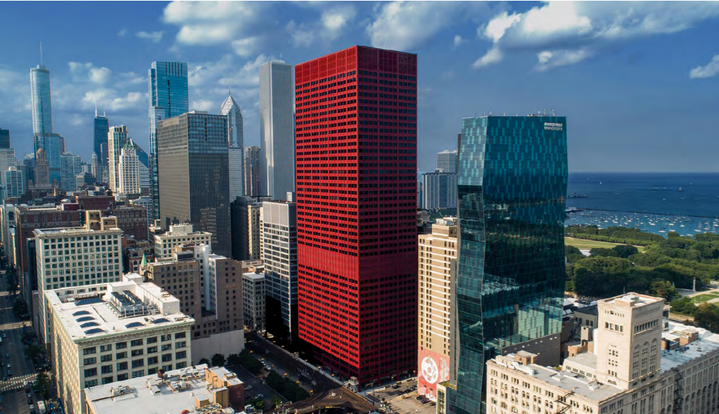
„BIG RED“ PRIME OFFICE TOWER – CHICAGO

Die Zertifizierung nach international anerkannten Zertifizierungssystemen (z. B. LEED, BREEAM) für ökologisches Bauen steht im Fokus, um das Bewusstsein für Umweltauswirkungen in den Regionen, in denen die DEUTSCHE FINANCE GROUP tätig ist, zu schärfen und zu fördern.