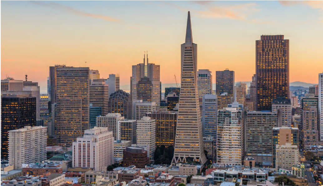
TRANSAMERICA PYRAMID – SAN FRANCISCO